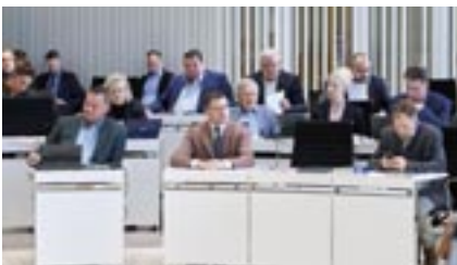
Abgeordnete der Fraktionen FDP und AfD.