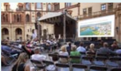
Im Innenhof des Schweriner Schlosses präsentierte der Bauhistoriker Dr. Paul Sigel am 6. September 2023 die Qualitäten der Schweriner UNESCO-Welterbe-Bewerbung.

Mit Blick auf die zweite Hälfte der Legislaturperiode wird die Entscheidung über Schwerins Bewerbung um den UNESCO-Weltkulturerbetitel mit Spannung erwartet.