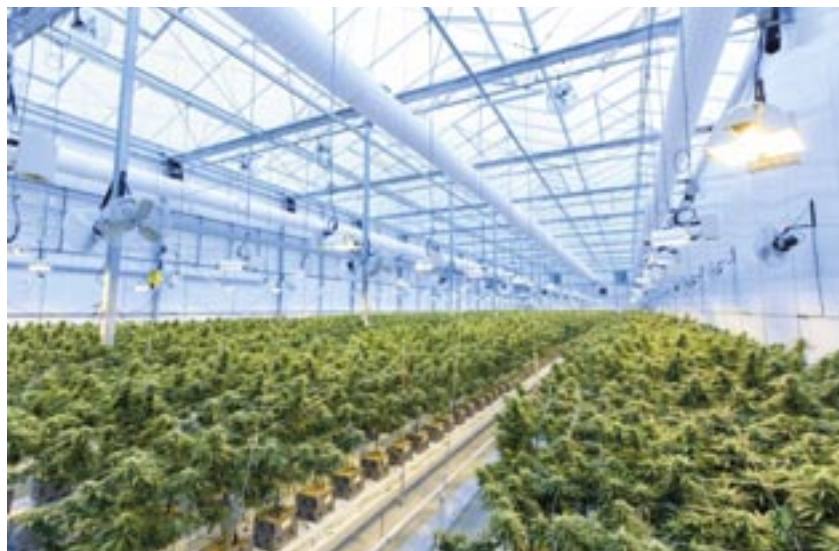
Professioneller Anbau von Cannabis-Pflanzen

Innenminister Christian Pegel (SPD) verwies darauf, dass das vom Bund geplante Cannabis-Gesetz ein sogenanntes Einspruchsgesetz ist. Die Länder könnten den Vermittlungsausschuss anrufen. Das bedeutet, dass selbst wenn der Bundes-