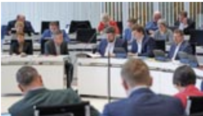
Abgeordnete der Fraktionen DIE LINKE und SPD.

97 Prozent der Ost-Rentner lebten allein von der gesetzlichen Rente, verdeutlichte Ministerpräsidentin Manuela Schwesig (SPD). Die sichere Rente habe mit Respekt vor der Lebensleistung zu tun und mit Vertrauen in die Demokratie. Sie finde es „dreist“, von Rentnern eine Nullrunde zu fordern, damit der Bundeshaushalt „klarkomme“ und erteile genauso Kürzungen oder der Erhöhung des Renteneintrittsalters eine Absage.