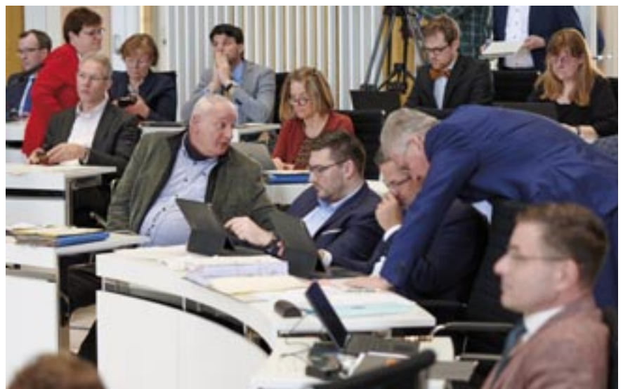
Abgeordnete der Fraktionen SPD, BÜNDNIS 90/DIE GRÜNEN, CDU und AfD.