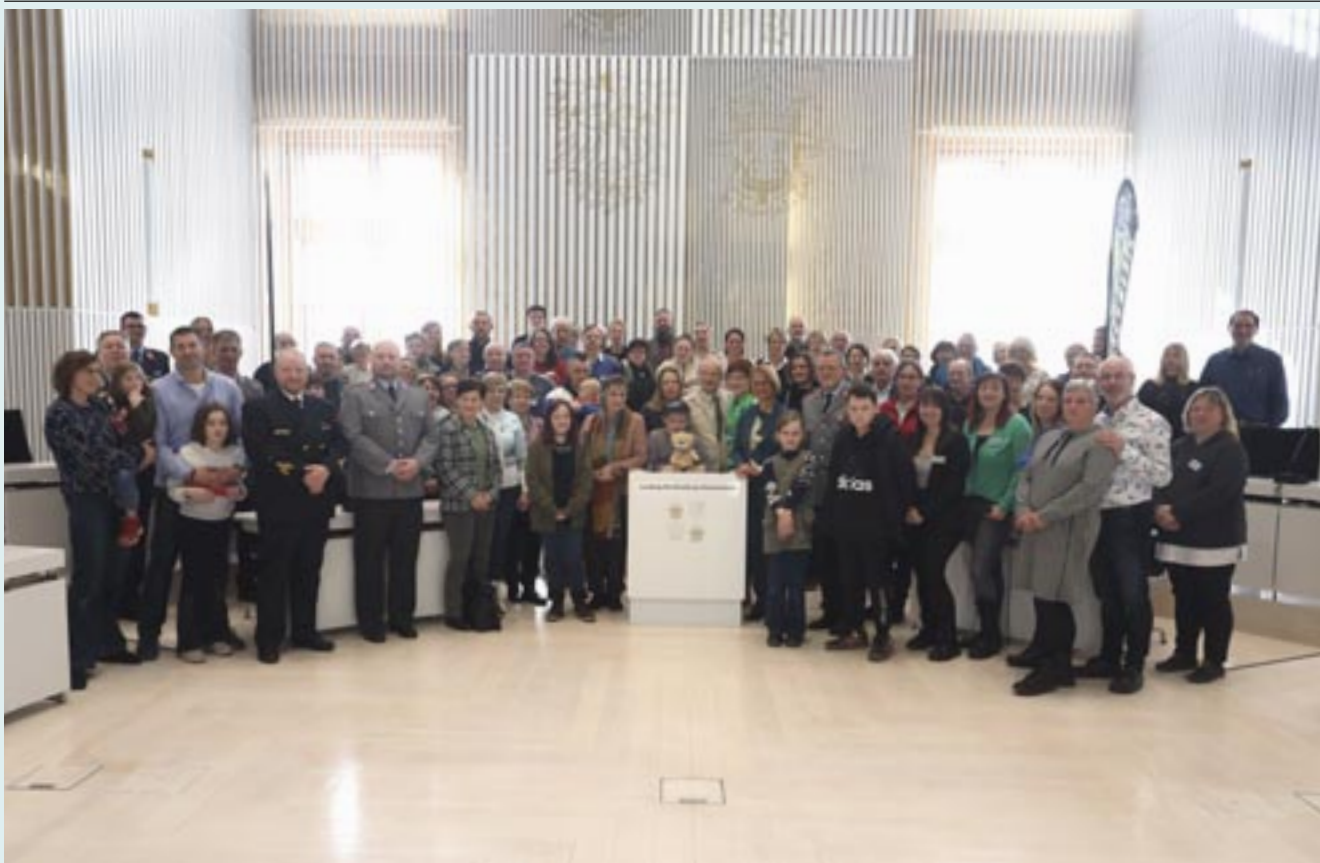
Gut 100 Mitglieder der Familienbetreuungszentren folgten der Einladung des Landtages und besuchten den Plenarsaal im Schweriner Schloss.