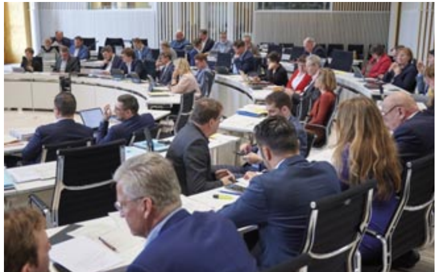
Vor Sitzungsbeginn finden meist die letzten Absprachen unter den Abgeordneten statt.