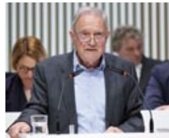
Horst Förster (AfD)