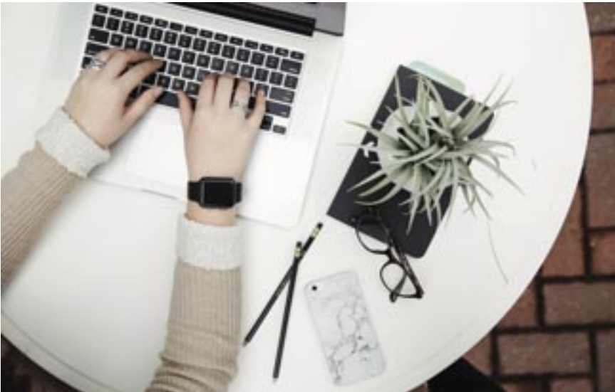
Arbeitgeberinnen und Arbeitgeber, die besonders auf die Gesundheit ihrer Mitarbeitenden achten, sollen zukünftig mit einem Preis geehrt werden.