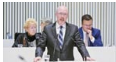
Innenminister Christian Pegel