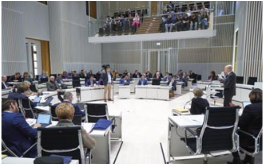
Innenminister Christian Pegel beantwortet die Frage des Abgeordneten Martin Schmidt (AfD).

habe. Gerade bei den Unterstützungsleistungen an die Wasser- und Bodenverbände, die dann eben keine kleine Zahl abbilden, sondern relativ viele Gemeinden jeweils zusammenfassen, wird es zur Stützung eben gerade dieser Verbandsbeiträge und zur Steigerung der Akzeptanz für die Art des Bibers auch 2024 und 2025 erneut Zuwendungen aus dem Landeshaushalt geben. Dieses Hohe Haus hat im Rahmen der Haushaltsberatungen 300.000 Euro als zusätzlichen Haushaltstitel eingeführt, noch mal, rekurrierend auf die Erfahrungen aus dem Haushaltsvollzug der Jahre 2020 und 2021.