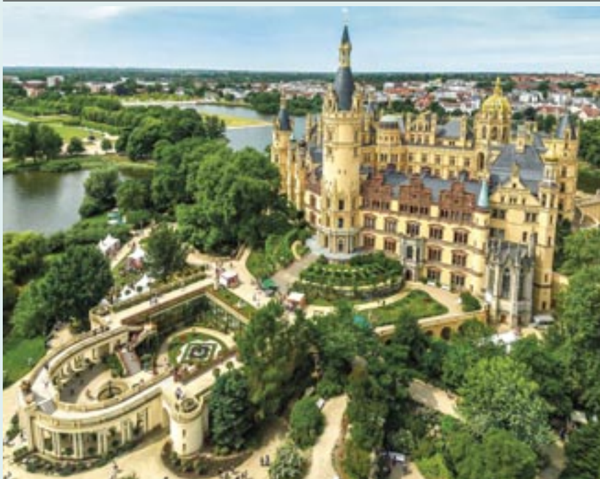
Am 19. Juni 2022 fand der erste Tag des offenen Landtages der neuen Wahlperiode statt.