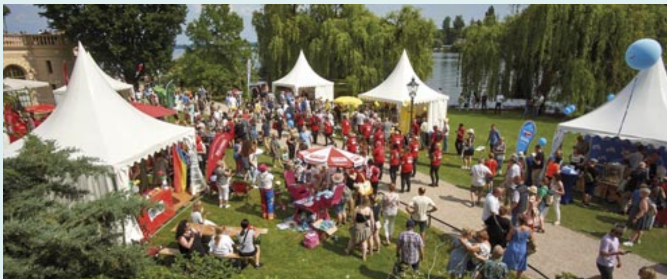
Buntes Treiben beim Tag der offenen Tür im Landtag am 25. Juni 2023.