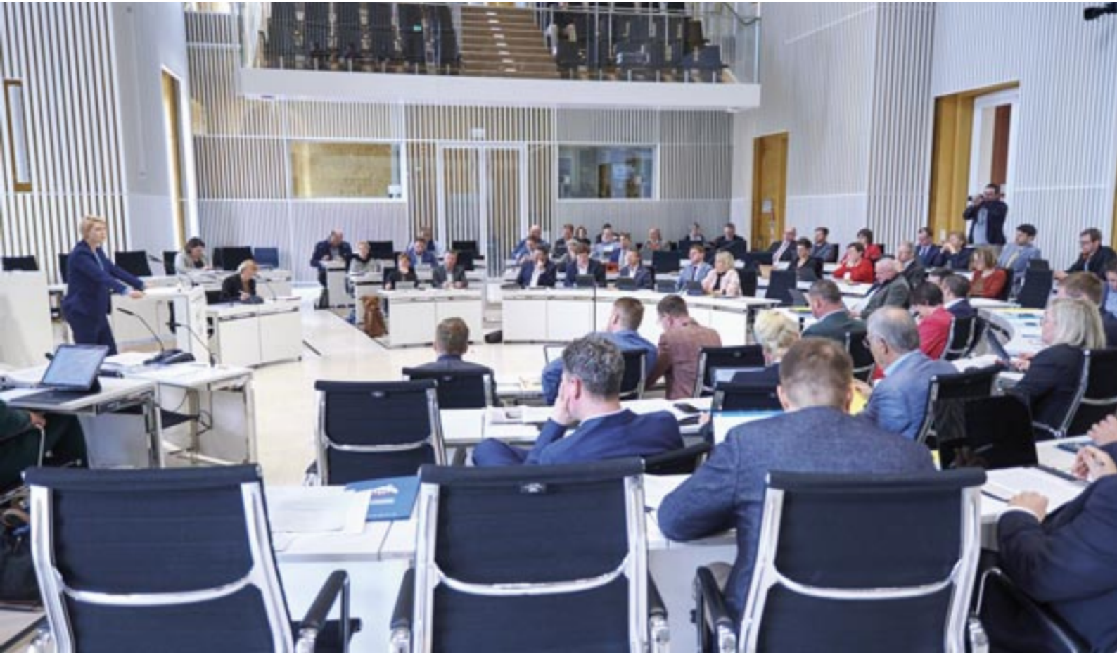
Ministerpräsidentin Manuela Schwesig während der Aktuellen Stunde.