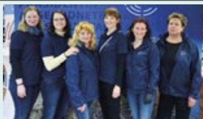
Die Mitarbeiterinnen des Landtages präsentieren die Arbeit des Parlaments.

Auch ein Team des Landtages MV war vor Ort, um über die Arbeit des Parlaments zu informieren. Interessierte Besucherinnen und Besucher konnten zudem am Landtags-Quiz teilnehmen oder