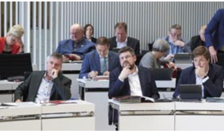
Abgeordnete der Fraktionen DIE LINKE und SPD

ell 18,6 Prozent auf im Jahr 2030 22,3 Prozent angehoben werden. Und das [...] das dürfte dann für die Arbeitnehmer und Arbeitgeber recht teuer werden. [...] Gleichzeitig werden auch die Arbeitgeber mit höheren Beiträgen belastet.