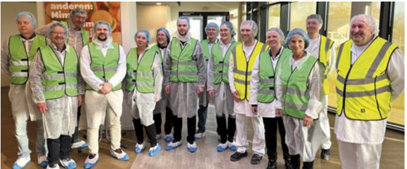
Die Mitglieder des Wirtschaftsausschusses zu Gast bei der Trolli GmbH in Hagenow.