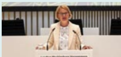
Am 13. Juni 2023 hatte Landtagspräsidentin Birgit Hesse zum Gedenken an den 70. Jahrestag des Volksaufstandes in der DDR in den Plenarsaal des Schweriner Schlosses eingeladen.