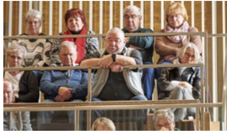
Seniorenbeirat Ludwigslust/Parchim auf der Besuchertribüne

[...] Eine Zuwanderung aus diesen Ländern beziehungsweise Regionen ist offensichtlich nicht geeignet, das Arbeits- und Fachkräfteproblem und somit auf lange Sicht das Rentenproblem bei uns zu lösen.