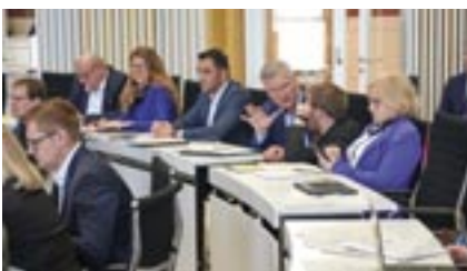
Abgeordnete der Fraktion CDU.