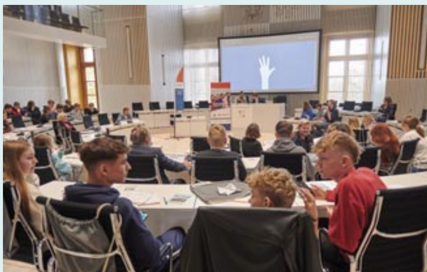
Jugendliche aus ganz Mecklenburg-Vorpommern kamen beim Beteiligungsformat „Jugend im Landtag“ im April 2023 mit Abgeordneten ins Gespräch.