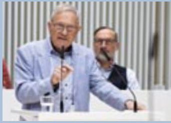
Horst Förster (AfD)