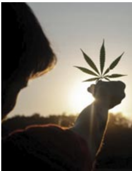
Hanf ist eine meist einjährige krautige Pflanze. Die Blätter sind handförmig zusammengesetzt.