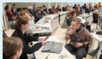
Jugendliche wo sonst Abgeordnete sitzen - bei „Jugend im Landtag“ ist dies alle 2 Jahre möglich.