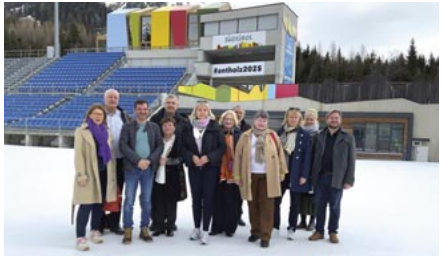
Die Ausschussmitglieder besuchten das Biathlon- und Langlaufzentrum Südtirol, Arena Alto Adige, in Antholz, wo 2026 die olympischen und paralympischen Biathlon-Wettkämpfe stattfinden werden.

Das Krankenhaus Innichen ist das Grundversorgungs Krankenhaus der Bevölkerung des Hochpustertals. Aufgrund der intensiven touristischen Aktivität in seinem Einzugsgebiet ist eine rasche orthopädisch-chirurgische Versorgung sehr wichtig. Ein weiterer Schwerpunkt der Fahrt war das selbstbestimmte Leben von Menschen mit Behinderungen. Hierzu traf sich die Delegation mit dem Monitoringausschuss-Südtirol, der die Umsetzung der UN-Behindertenrechtskonvention überwacht, um mehr über die Arbeitsweise des Gremiums zu erfahren. Der Südtiroler Monitoringausschuss für die Rechte von Menschen mit Behinderungen wurde mit dem Landesgesetz