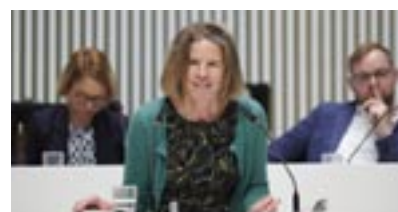
Constanze Oehrich, BÜNDNIS 90/DIE GRÜNEN