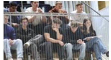
Schülerinnen und Schüler des Bildungszentrums Schwerin verfolgen die Befragung der Landesregierung.

Sie werden beantworten müssen, ob Sie das Gutachten weiterhin ernst nehmen wollen. Das haben Sie bisher in Ihren Beiträgen getan. Wenn Sie sie jetzt in der Weise desavouieren, ihr vorzuwerfen, sie hätte quasi auftragsgemäß Dinge reingeschrieben oder gestrichen, was abenteuerlich ist, was sie selbst öffentlich auch ausdrücklich in Abrede gestellt hat, werden Sie mitteilen müssen, auf welcher