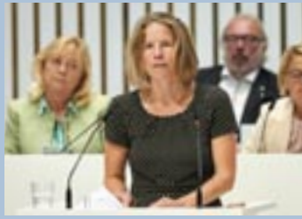
Constanze Oehrich (BÜNDNIS 90/DIE GRÜNEN)