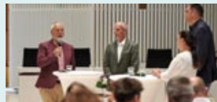
Am 28. Juni 2023 nahmen Markus Meckel (Vorsitzender des Stiftungsrates der Bundesstiftung zur Aufarbeitung der SED-Diktatur), der Theologe Eckart Hübener und Anne Drescher, (damals Landesbeauftragte für Mecklenburg-Vorpommern) an einem Schlossgespräch zum Thema Aufarbeitung der SED-Diktatur teil.