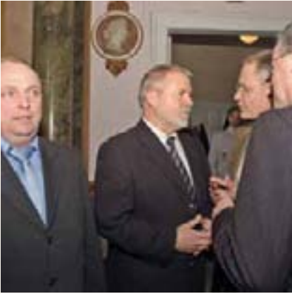
Die Jahresempfänge der LPK sind willkommener Anlass für Journalisten, Politiker und Vertreter verschiedener Einrichtungen und Verbände, ungezwungen miteinander ins Gespräch zu kommen.