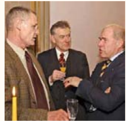
... und manches auch „Unter Drei“.