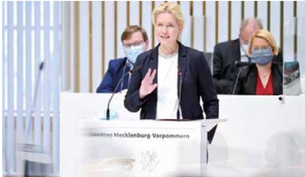
Ministerpräsidentin Manuela Schwesig