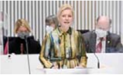
Ministerpräsidentin Manuela Schwesig