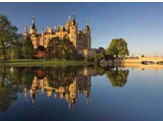
Das Schweriner Schloss beherbergt seit 1993 auch die LPK in seinen Räumen.

30 Jahre Landespressekonferenz in Mecklenburg-Vorpommern