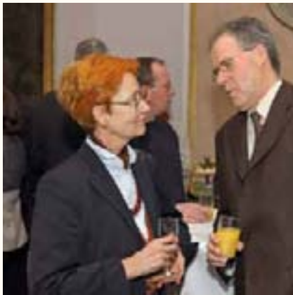
Manches an diesem Abend läuft unter Zwei...

Zugleich hat sich die Landespressekonferenz in all den Jahren auch immer wieder positioniert, wenn es zwischen Journalisten und der jeweiligen Regierung, aber auch anderen Behörden und Organisationen zu Unstimmigkeiten kam. So wies die LPK beispielsweise