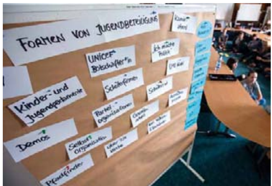
Mit den Beteiligungsformaten „Jugend im Landtag“ und „Jugend fragt nach“ bietet der Landtag MV gemeinsam mit dem Landesjugendring regelmäßig Möglichkeiten für den Austausch zwischen Abgeordneten und jungen Erwachsenen an.