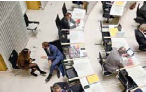
Abgeordnete der SPD-Fraktion im Landtag MV.