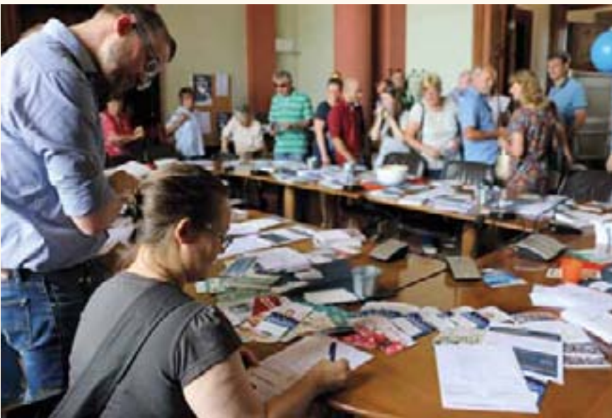
Großer Andrang herrschte beim Datenschutzbeauftragten.