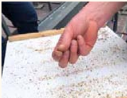
Die Analyse der Bestandteile auf der Bodeneinlage gibt Auskunft über die Pollenvielfalt und den Gesundheitszustand der Bienenvölker.