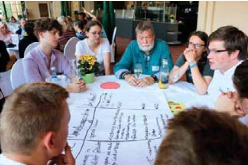
Die Jugendlichen besprachen ihre Ideen und Kritikpunkte mit den Landtags-Abgeordneten.