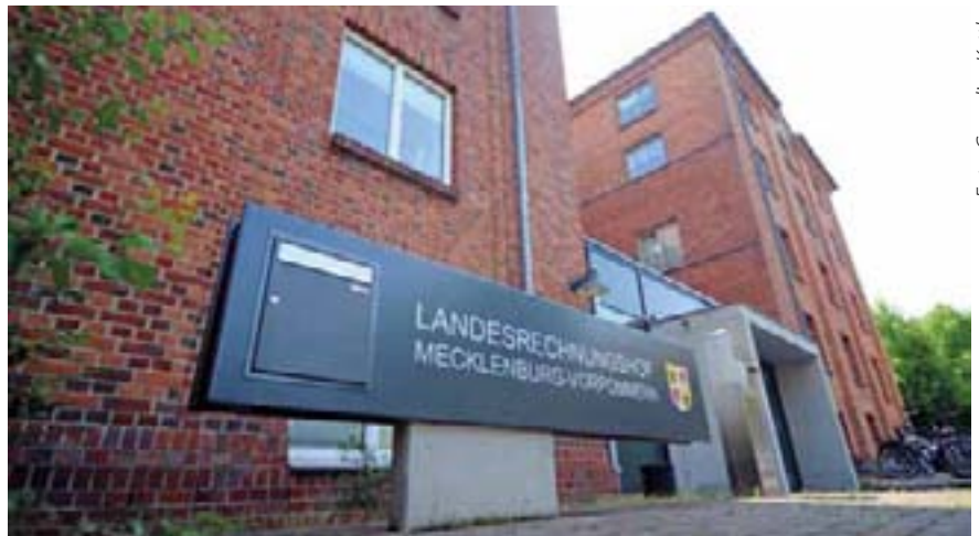
Der Landesrechnungshof Mecklenburg-Vorpommern

Die Koalitionsfraktionen betonten, dass das Justizministerium die 2014 in Kraft getretene Gerichtsstrukturreform in diesem Jahr evaluieren werde. Diese Ergeb-