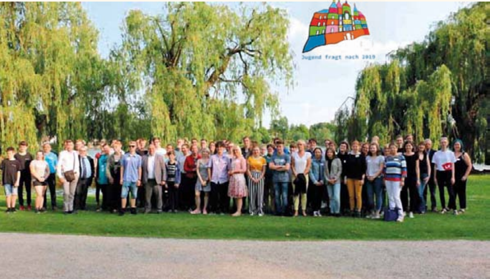
Gruppenbild mit Abgeordneten: 50 Jugendliche nahmen bei "Jugend fragt nach 2019" teil.