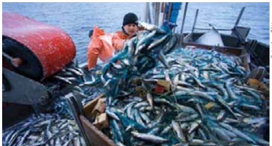
Küstenfischer holen ihren Fang ein.

„Wir reden hier nicht über große Fischerflotten, die mit gewaltigen Netzen die Meere durchpflügen. Wir reden von kleinen Kähnen, die in den küstennahen