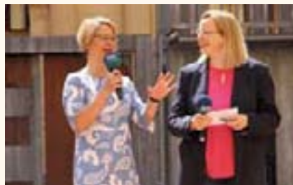
Landtagspräsidentin Birgit Hesse begrüßt die Gäste im Innenhof des Schweriner Schlosses.

Sie nutzten das vielfältige Programm von Information, Mitmachen und Unterhaltung von der Eröffnung um 10 Uhr durch Landtagspräsidentin Birgit Hesse bis zum Glockenschlag um 17 Uhr.