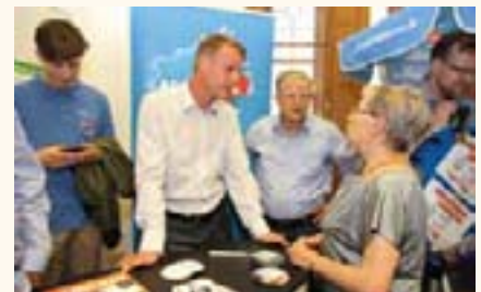
Nikolaus Kramer (AfD)