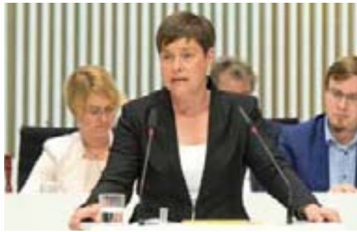
Eva-Maria Kröger (DIE LINKE)