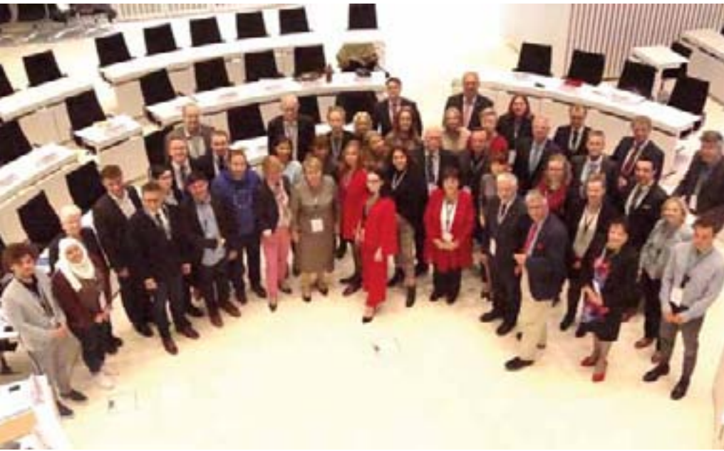
Die Mitglieder der Arbeitsgruppe „Migration und Integration“ und des Parlamentarischen Jugendforums der Ostseeparlamentarierkonferenz (BSPC) im Plenarsaal