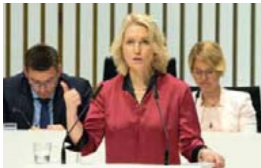
Ministerpräsidentin Manuela Schwesig