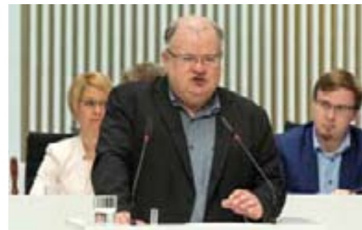
Bert Obereiner (AfD)