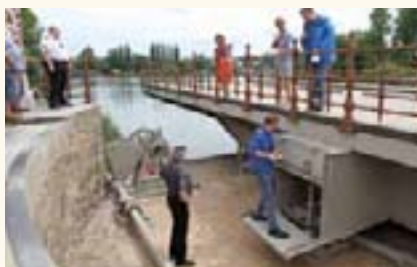
Zum Tag der offenen Tür des Landtages wurde die Drehbrücke geöffnet