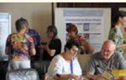
Der Petitionsausschuss stellte seine Arbeit vor.