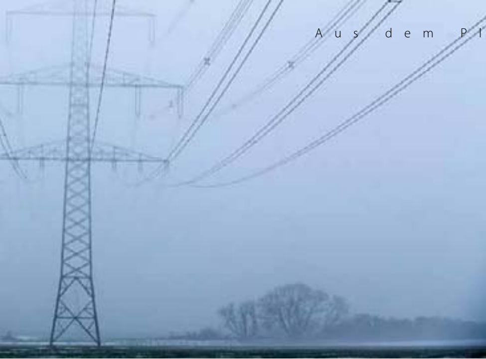
des Bundesrates, die Netzausbaukosten gerecht auf alle Bundesländer zu verteilen.