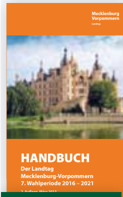
Handbuch der 7. Wahlperiode

Diese und weitere Druckerzeugnisse können Sie auf der Internetseite des Landtages herunterladen oder bestellen. Eine Bestellung ist auch telefonisch möglich unter der Rufnummer 0385 / 525 2113.