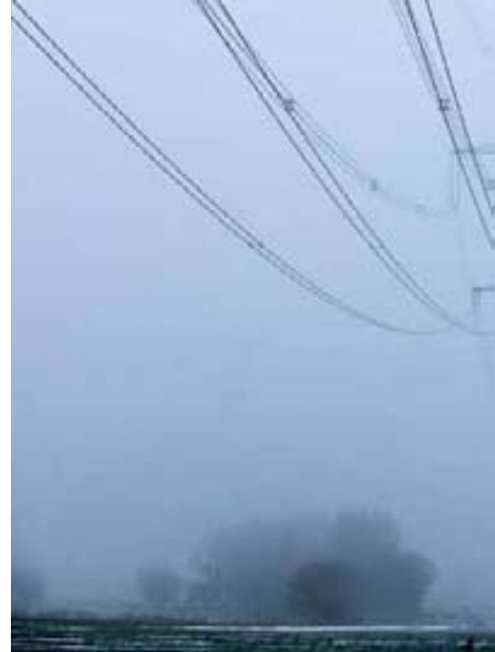
Mecklenburg-Vorpommern unterstützt die Forderung

■ Bei der Energiewende gehört Mecklenburg-Vorpommern zu den Vorreitern. Rund 70 Prozent des gesamten im Nordosten produzierten Stroms stammt bereits aus Windkraft, Sonnenenergie oder Biogasanlagen. Strom, von dem auch andere Bundesländer profitieren. Die für den Netzausbau anfallenden Kosten werden auf die Netzentgelte umgelegt – allerdings nur dort, wo der Strom erzeugt wird. Eine sogenannte bundesweite Umwälzung findet bislang nicht statt. Das kritisiert der Landtag seit Langem. Nun stand das Thema am 8. März wieder auf der Tagesordnung. SPD, CDU und DIE LINKE hatten gemeinsam einen Dringlichkeitsantrag eingebracht. Grund war eine anstehende Abstimmung im Bundesrat über das Gesetz der Bundesregierung zur Neustruktur der Netzentgelte. Mit dem Antrag forderte der Landtag die Landesregierung auf, den Gesetzentwurf zu unterstützen.