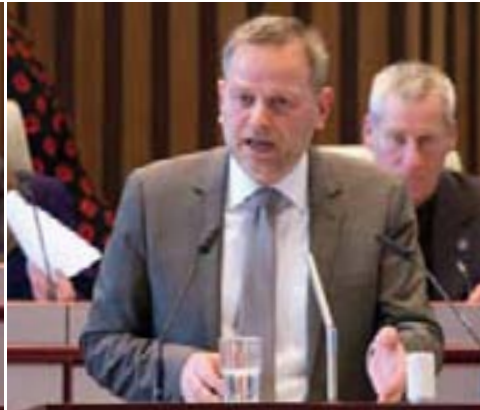
Leif-Erik Holm (AfD)