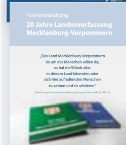
20 Jahre Landesverfassung