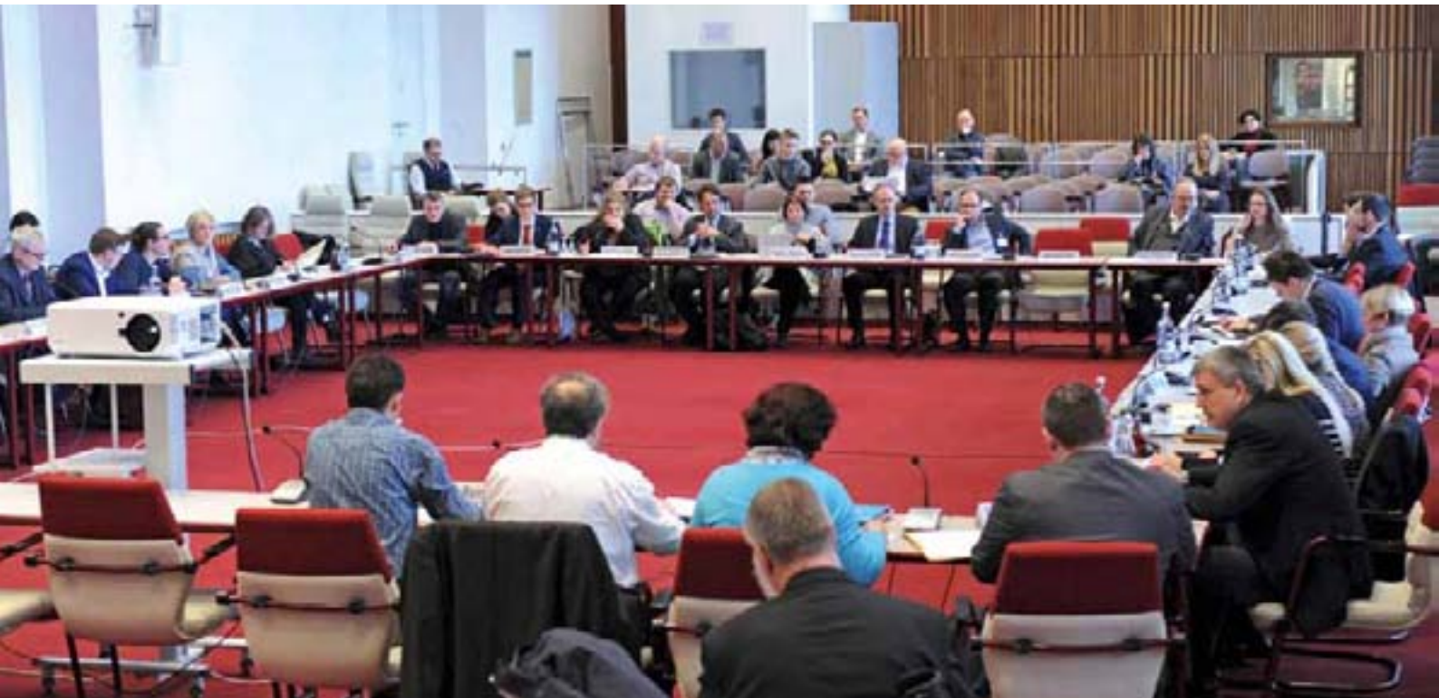
Öffentliche Anhörung des Bildungsausschusses zur Änderung des Schulgesetzes.