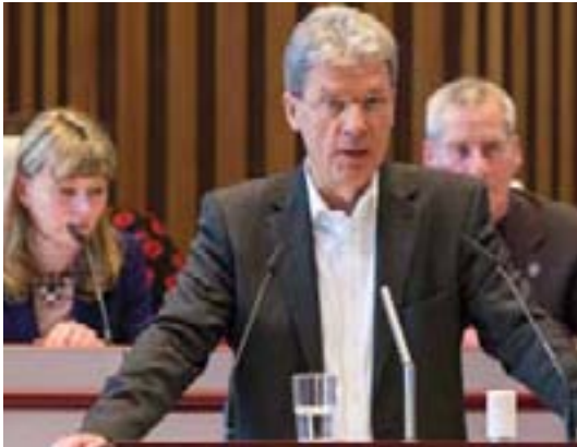
Helmut Holter (DIE LINKE)