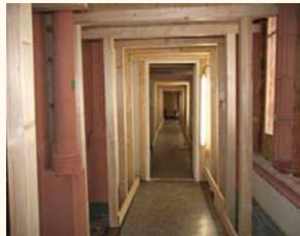
Der Kirchgang wird statisch gesichert und restauriert.

Diese Maßnahme erfolgt unter der Regie des Landesbetriebes für Bau und Liegenschaften (BBL). Es geht um die statische Sicherung sowie die Restaurierung des Außen- und Innenraumes. Die Landtagsverwaltung hat erreicht, dass die Fraktionsräume in diesem Bereich trotz der Bauarbeiten weiter genutzt werden können.