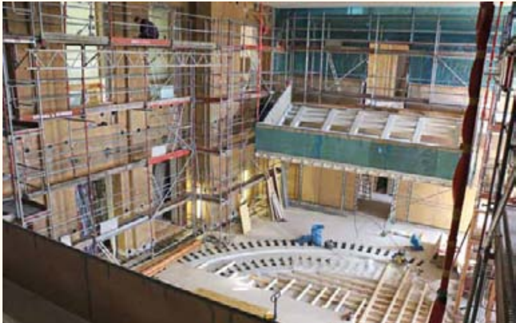
Man kann schon gut die kreisrunde Form für die Abgeordneten-Plätze erkennen, die Galerien für Besucher und Medien sind auch bereits eingebaut.

Die Treppe, die vom Innenhof in die Hofdornitz führt, wird komplett saniert und erhält eine separate Gründung.