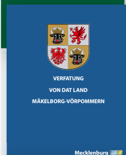
Landesverfassung auf plattdeutsch