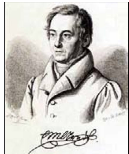
Ernst Moritz Arndt (1769-1860)