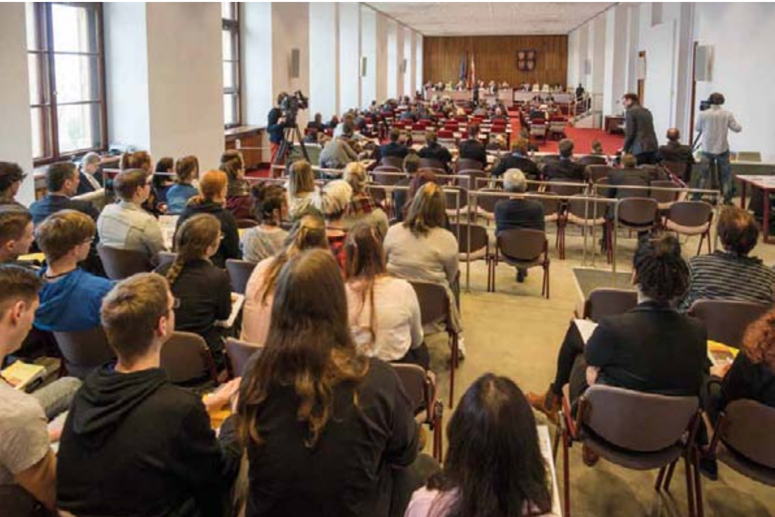
Die Plenarsitzungen des Landtages M-V sind öffentlich. Schulklassen, Wahlkreisgruppen und Einzelinteressenten können die Debatten von der Besuchertribüne aus verfolgen.

wie Wind- und Solarstromanlagen betreffen, aber keine Kraft-Wärme-Kopplungs-Anlagen. Der Beschluss weicht damit in beiden Punkten von den Plänen der Bundesregierung ab. Deren Entwurf zum Netzentgeltmodernisierungsgesetz sieht keine bundesweite Umwälzung der Übertragungsnetzentgelte vor und will die vermiedenen Netzentgelte schrittweise komplett abschaffen.