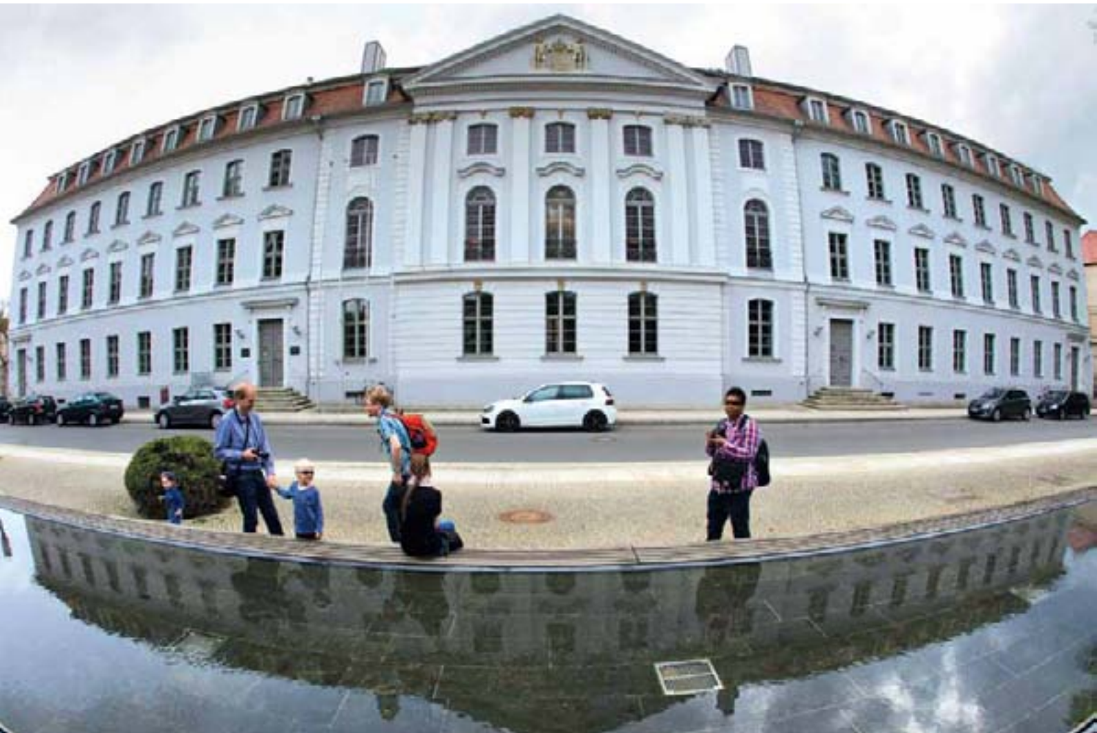
Von 1933 bis 1945 trug die Uni Greifswald den Namenszusatz „Ernst Moritz Arndt“. Dann bis 1954 ohne Namenspatron, kehrte man 1954 zur Bezeichnung „Ernst-Moritz-Arndt-Universität Greifswald“ zurück.