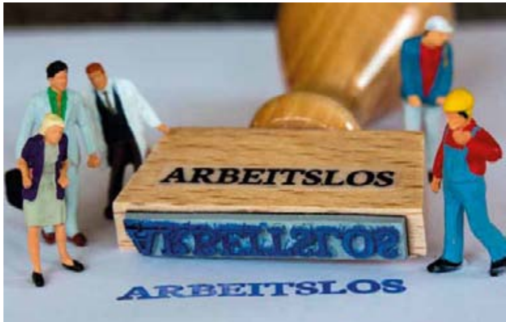
Der wirtschaftliche Aufschwung ist im Land ungleichmäßig verteilt. Einer Arbeitslosenquote von sieben Prozent im Landkreis Ludwigslust-Parchim stehen beispielsweise 13,4 Prozent im Kreis Vorpommern-Rügen gegenüber.