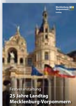
25 Jahre Landtag M-V