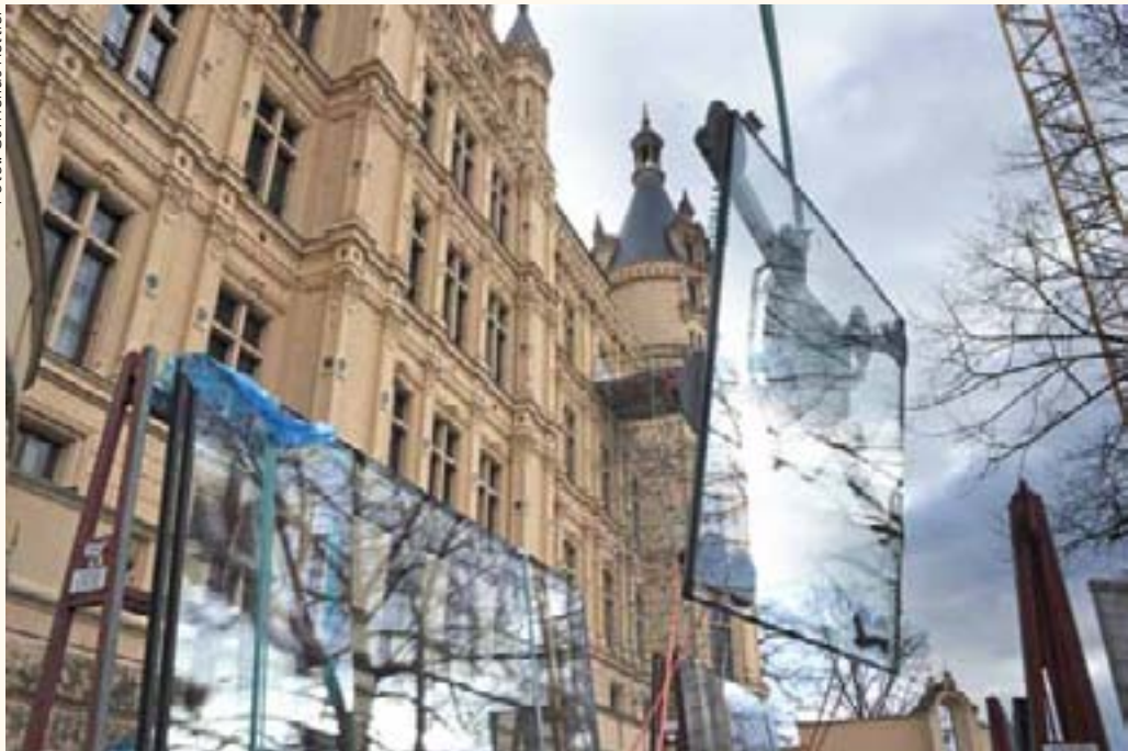
Anfang März wurden per Kran die bis zu 800 kg schweren Glaselemente für die Plenarsaal-Tribünen ins Schloss bugsiert.