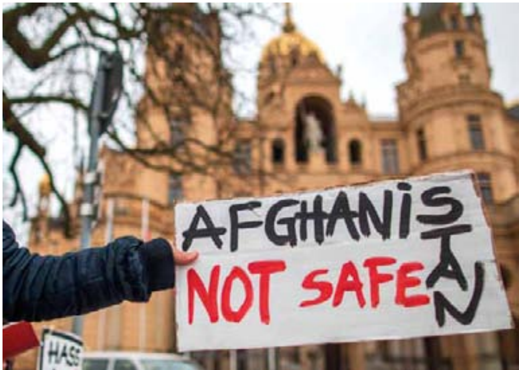
Parallel zur Landtagsdebatte machten vor dem Schloss Flüchtlinge aus Afghanistan auf die Lage in ihrem Heimatland aufmerksam.

Am 18. Januar 2017 beschloss der Akademischen Senat der Universität Greifswald, dass die Hochschule den Namenszusatz „Ernst Moritz Arndt“ ablegen soll. Bei einer Stimmenthaltung votierten von den 36 Senatorinnen und Senatoren 24 für die Ablegung des Namens, 11 stimmten für die Beibehaltung. Laut Hochschulgesetz kann die Uni über ihren Namen selbst entscheiden, nur der Sitz der Hochschule muss im Namen enthalten sein. Das Bildungsministerium prüft lediglich, ob die Namensgebung formal rechtmäßig erfolgt ist. In diesem Fall versagte es vorerst die Zustimmung, da der Abstimmungsprozess in der Uni nicht gemäß Landeshochschulgesetz erfolgte.