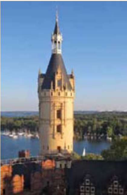
Der Hauptturm bekommt eine Generalüberholung.