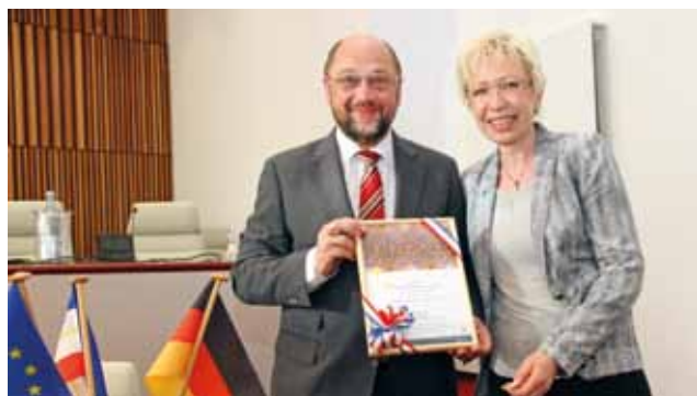
EU-Parlamentspräsident Martin Schulz freut sich über einen Stern der Schweriner Schlosskirche.

Ein Höhepunkt des Parlamentsforums war der Besuch von Martin Schulz, Präsident des Europäischen Parlaments. Mit einer beeindruckenden und mitreißenden Rede zur Zu-