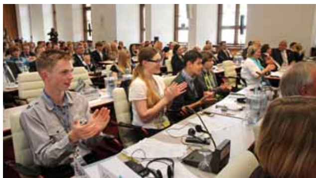
Jugendliche beim Forum mit Martin Schulz

Für die zweitägige Jahreskonferenz kamen rund 90 Parlamentarier, Sachverständige und Verwaltungsmitarbeiter aus