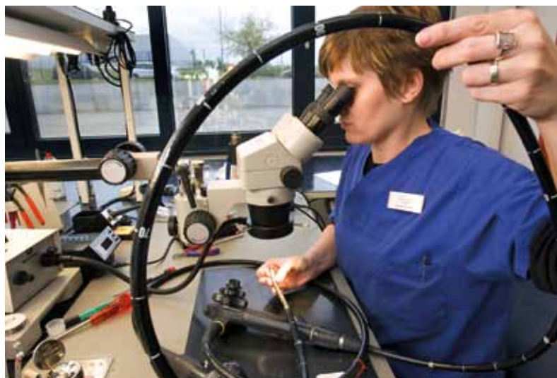
Mit über 20 qualifizierten Mitarbeitern bietet die Firma EndoComplete Services GmbH & Co. KG in Dassow hochwertige Dienstleistungen rund um flexible Endoskope an.