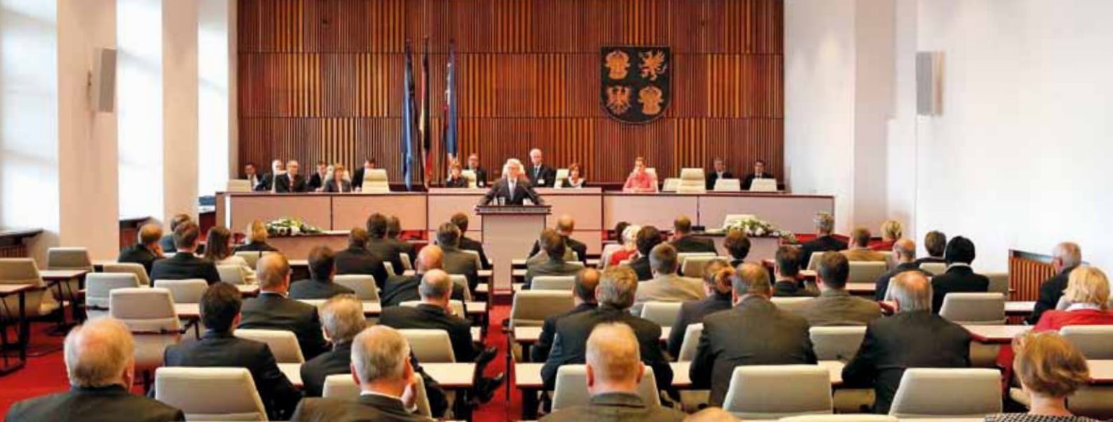
Joachim Gauck bei seiner Rede im Landtag. Die NPD-Fraktion blieb der Veranstaltung fern.