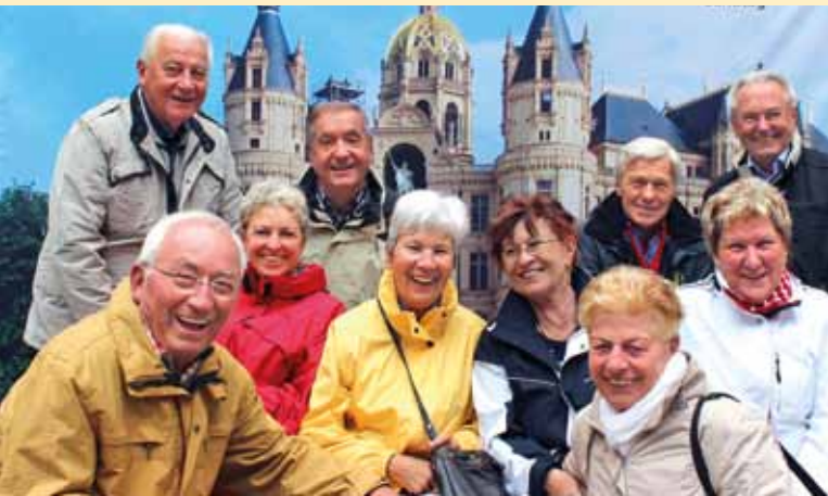
Fotoaktion vor täuschend echter Schlosskulisse