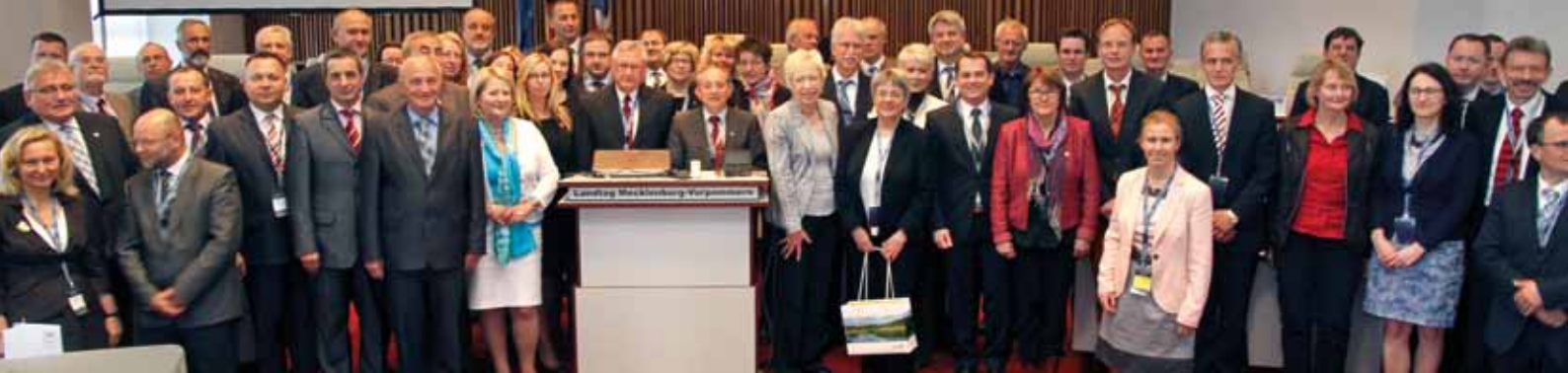
Die Teilnehmerinnen und Teilnehmer des XI. Parlamentsforums Südliche Ostsee