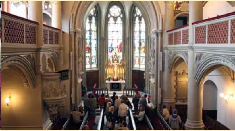
Besuchermagnet: die frisch restaurierte Schlosskirche