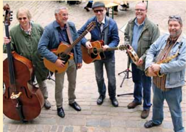
Die Band DE PREUSCH sorgte für gute Stimmung.

Wandgemälde, das im Vorraum wieder gezeigt werden soll. Dies sei sein Verständnis von zeitgemäßer Architektur. Die Kosten sollen überschaubar bleiben, wie Sylvia Bretschneider unterstrich. Bislang sind 21,5 Millionen Euro für das gesamte Projekt veranschlagt, zusätzlich stehen 4,5 Millionen Euro als Risiko-Reserve bereit. Rund sieben Millionen Euro der Gesamtsumme sollen in die Neugestaltung des Plenarsaals fließen. Allein zehn Millionen Euro sind für die Grundsicherung des Schlossgartenflügels geplant. Statik und Brandschutz müssten dringend verbessert werden. „Spätfolgen des Schlossbrandes von 1913, die wir erst jetzt mit dem Beginn der Umgestaltung bemerkt haben“, erklärte die Präsidentin. Diese Arbeiten hätten auch ohne neuen Plenarsaal ausgeführt werden müssen. 4,5 Millionen Euro sind zudem für das neue Kongress- und Medienzentrum geplant. Das Bauvorhaben soll „möglichst schnell, aber mit der gebotenen Sorgfalt umgesetzt werden“, verspricht Bretschneider. Der Architekt wagt eine präzise Zeitangabe. „Ich denke, Ende 2016 wird der neue Plenarsaal fertig sein“, sagt Tilmann Joos. Die ersten Sitzungen in der dann 7. Wahlperiode werden wohl noch im alten Ambiente stattfinden. Aber dann soll die Baustelle endgültig als Schaustelle zur Verfügung stehen. Für den Souverän, der von „oben“ über das demokratisch gewählte Parlament wacht.