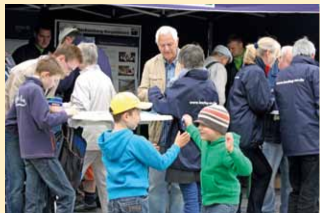
WIR-Vielfaltsmeile vor dem Schloss