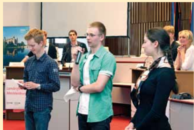
Schaubetten im Plenarsaal