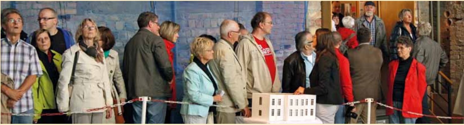
Besucherstrom auf der Baustelle für den neuen Plenarsaal