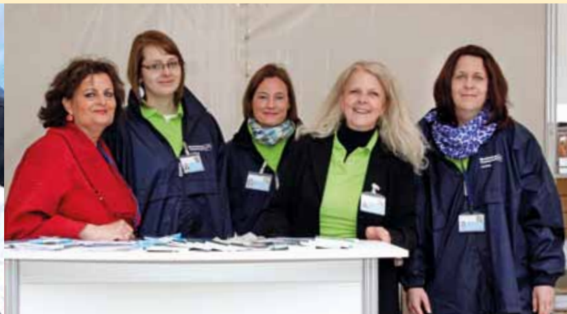
Mitarbeiterinnen der Landtagsverwaltung sorgten für Orientierung und Information.