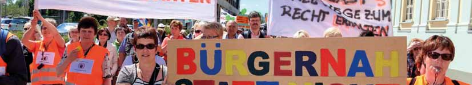
Demonstration für den Erhalt von Amtsgerichten