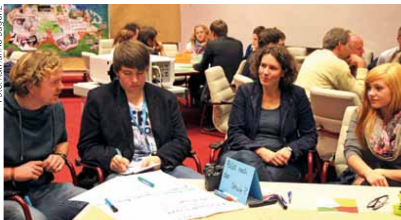
Die Teilnehmerinnen und Teilnehmer von „Jugend im Landtag 2012“ diskutieren mit den Abgeordneten auch ihre Forderungen für eine bessere Schule.

Sozialfonds angewiesen. Daraus werden zu einem Teil die Personalkosten für Jugend- und Schulsozialarbeiter bestritten. Dem Änderungsantrag der Linken werde seine Fraktion nicht zustimmen.